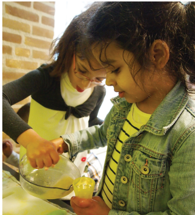
Rollenspel in de 'winkel' 2 Werken aan de beeldende opdracht

Meer informatie: www.innovatieimpulsonderwijs.nl